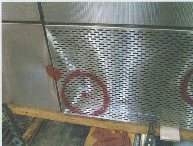
Qualitätsprodukte aus der Pohl-Gruppe